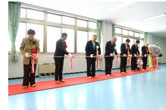
保育所開所式の様子

学内保育所の設置に向け、運営業務委託業者の選定（4 月）や保育所管理運営委員会の設置（5 月）、保育所の管理・運営に関する規程の策定（9 月）、入園希望者に対する保育所説明会（10 月）等を行い、平成 30 年 3 月 1 日に地元企業である岩手銀行と共同で事業所内保育所「岩手大学・岩手銀行保育所（愛称：がんちゃんすくすく保育園）」を開所した。本保育所設置事業は、国立大学と地方銀行が連携して、企業主導型保育事業を活用し開設する全国初となる取組で、地域からの関心も高く、テレビニュースや新聞記事にも取り上げられたほか、複数の大学からヒアリング調査の依頼があるなど先導的な取組となった。なお、入所定員 12 名のうち、平成 30 年 3 月末までに 11 名（4 月入所予定含む）の入所が決定し、学内及び地域のワーク・ライフ・バランス実現にも大きく貢献した。