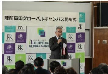
陸前高田グローバルキャンパス開所式

2018」を開催し、地元中高生を含む 230 名が参加した。これらの取組により、陸前高田グローバルキャンパスの平成 29 年度年間利用者数は 4,607 人となり、当初の目標(5 年間で 5,000 人)を大きく上回るペースで利用が広がっている。また、利用する機関(ハーバード大学(米国)、スタンフォード大学(米国)、プリンストン大学(米国)、東京大学、東京農業大学、岩手県、復興庁等)も国内外にわたっており、重要な交流活動拠点となっている。