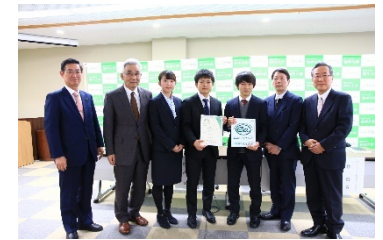
エコアクション 2.1 認証登録授与式

新たな岩手大学の環境マネジメントシステム運営の展開を図ることを目的に、「エコアクション 2.1」の認証審査を受審し、「エコアクション 2.1 ガイドラインに適合」の総合判定を受け、エコアクション 2.1 地域事務局の判定委員会への審査報告書による認証・登録の推薦を受けた。報告書では、環境マネジメント学生委員会の積極的な環境活動や省エネルギーへの取組等優れている点が 6 点、指導事項 2 点、推奨事項 6 点のコメントがあった。その後、エコアクション 2.1 地域事務局の判定会議等を経て、平成 29 年 12 月 25 日に東北地方の国立大学で初めて「エコアクション 2.1」を認証取得した。