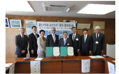
岩手三陸連携会議との連携協定締結式

岩手県沿岸市町村 13 自治体が構成メンバーとなっている「岩手三陸連携会議」と「地域創生」「イノベーション創出」「広域観光の強化」「三陸ブランドの推進と産業振興」に向けた連携・協力を行うことを目的とした協定を平成 29 年 9 月 22 日に締結した。その取組の一つとして、釜石市と連携した観光分野における地域創生モデル構築プロジェクトをスタートさせ、三陸復興・地域創生推進機構の平泉文化教育研究部門と三陸復興部門が連携し、世界遺産の橋野鉄鉾山の歴史的価値を把握する市民やグループの拡大と釜石市観光振興ビジョンへの支援に取り組んでいる。